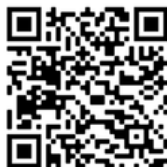
QR para iOS App Calidad del Aire

https://www.comunidad.madrid/servicios/urbanismo-medio-ambiente/calidad-aire#plan-accion-contaminacion-ozono